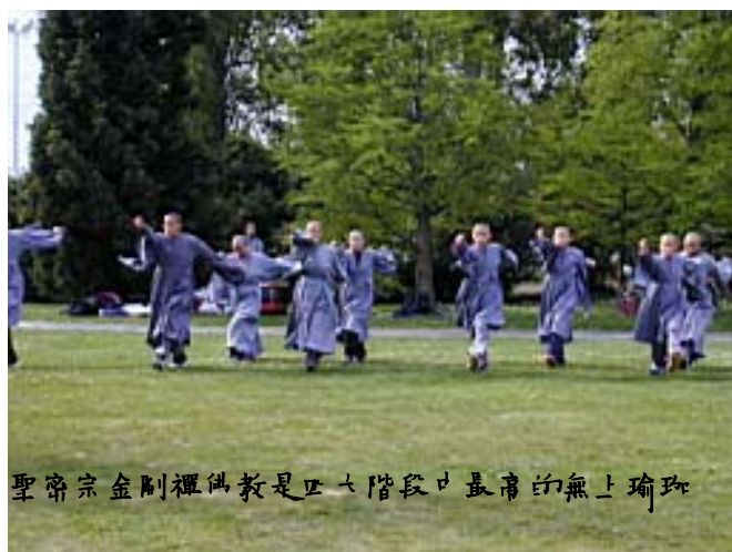
聖密宗金剛禪佛敎是五大階段中最高的無上瑜珈

此中陰天之黑暗並非伸手不見五指的那種黑暗，而是眾生受自己的業力所包裹，尤如一個人被東西包牢一般。眾生前途沒有光明，不知未來如何。