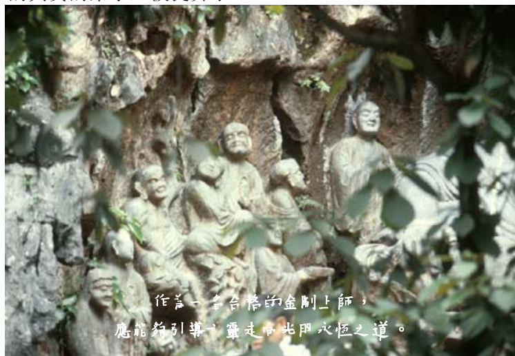
作善一言合際的金剛上師，應能為引導，盡走南北印穴恆之道。

五、大惡之人，大魔頭，由於作業太深，不需經中陰天，經“他審法庭”，直接進入無間地獄。